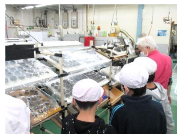
11月5日 工場見学 佐渡精密（5年）