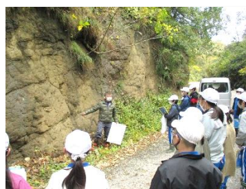
11月4日 地層見学 沢根層（6年）

教科だけでなく、総合学習や特別活動など、バランスよくすべての勉強をがんばる月として、充実の秋を締めくくろうと取り組んでいます。