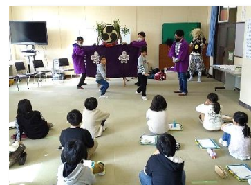
11月13日 伝統芸能学習 鬼太鼓（4年）