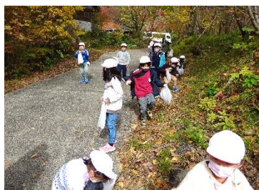
11月6日 秋さがし 紅葉山（1年）