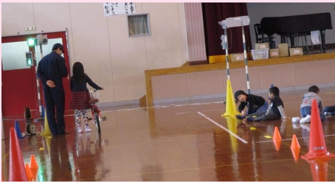
交通ルールを守り、安全に自転車に乗ってください。