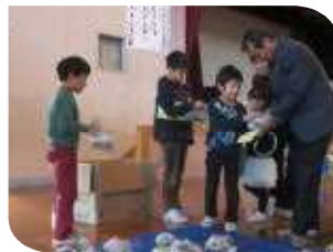
「手さわりゲームや」